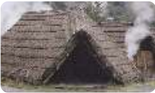
別府温泉・湯の花精製小屋