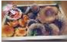
▲旬のキノコのお歳暮

「美容と健康の宝庫」といわれるキノコは、ビタミンやミネラルなどが豊富なことから、近年は若い女性から健康に関心が高い高齢者まで、幅広い年代に人気がある食材です。そのキノコを専門に扱うお店として、お店をすませ、注目を集めようとしています。