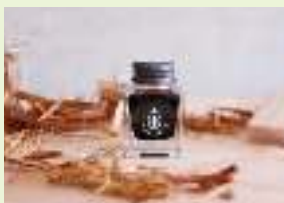
「ひみ里山杉からできたインク(25ml)」

こうして2021年に業界初となる「ひみ里山杉からできたインク/つけペンセット」が誕生した。インクは、スギの樹皮から抽出した染料ならではの深い褐色の色合いで、つけペンのペン軸にはひみ里山杉の圧縮材が使われている。