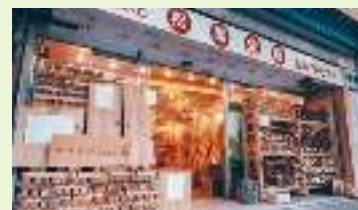
地場産木材の製品や端材が手軽に手に入る「Himi Brico Labo(ヒミ・ブリコ・ラボ)」。地産地消でウッドマイレージに優れ、地元産の木材によるDIYが楽しめる。

れた。「木の良さや価値を再発見させる製品や取組」として高く評価されたものである。また、氷見市街の空き店舗でひみ里山杉による製品や端材などを販売する同社の「Himi Brico Labo(ヒミ・ブリコ・ラボ)」も、ウッドデザイン賞に選ばれている。