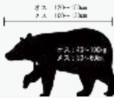
環境省の資料より

▶富山県内に生息するツキノワグマは推定1460頭(2020年)。体長100~150cmほど(成獣/オスが大きい)、体高50~60cm前後、体色は黒色。野生での寿命は15~20歳程度。(※クマのイラスト/環境省の資料より)