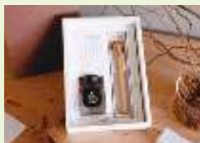
「ひみ里山杉からできたつけペンセット(染料インク(25ml)+つけペン1本+ペン先2本+ペンレスト1個)」

そして2022年にはウッドデザイン賞(日本ウッドデザイン協会主催)ライフスタイルデザイン部門の奨励賞に選ば